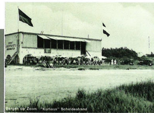
Bergen op Zoom "Kurhaus" Scheldestrand