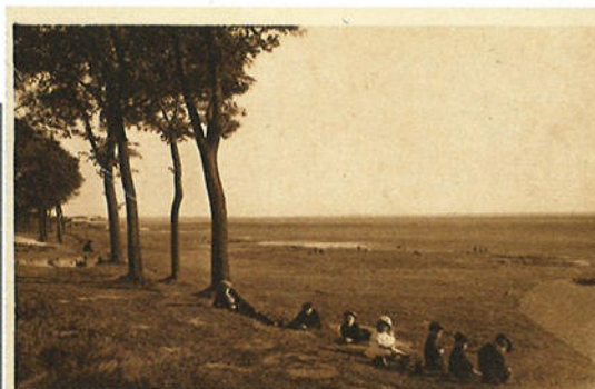
Bergen op Zoom

Op de volgende pagina's nemen we u mee terug in de tijd - 200, 150 en 100 jaar geleden - naar het Scheldestrand, Mattemburgh, Wouwsche Plantage, Grootte Meer, Liesbosch, Mastbosch, Ulvenhoutsche Bosch, Strijdhoeve, Nieuwkerk, De Utrecht, Oisterwijkse Vennen en Kasteel Heeswijk. Hoe lagen en liggen ze er nu bij? Hebben ze het toerisme overleefd?