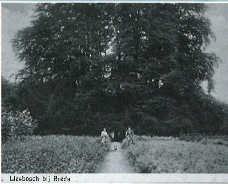
Liesbosch bij Breda