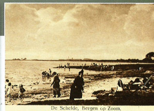
De Schelde, Bergen op Zoom.

Vlakbij de stad Bergen op Zoom was het goed toeven aan het strand, compleet met een 'Kurhaus', ± 1920.