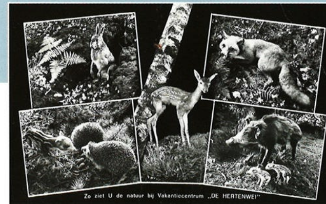
Zo ziet U de natuur bij Vakantiecentrum „DE HERTENWEI“