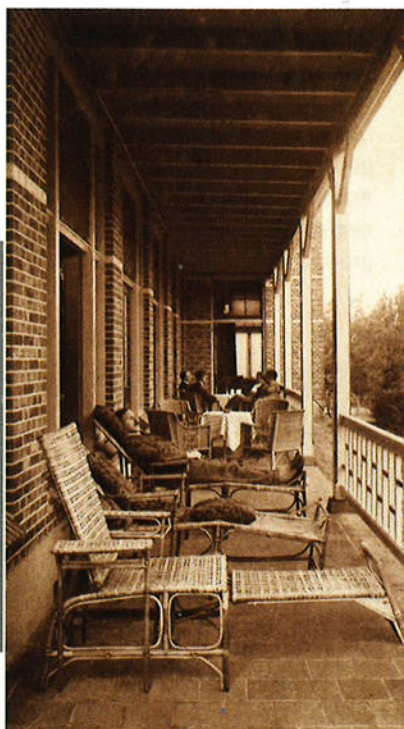
Veranda van „Dennenheuvel“

Goed, mensen kwamen op 'Dennenheuvel' bij Ossendrecht om te herstellen, maar dat betekent 're-creëren' letterlijk ook, ± 1920.