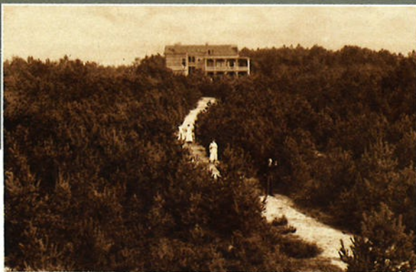
Gezicht op „Dennenheuvel“