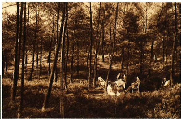
Boschgezicht op „Dennenheuvel“