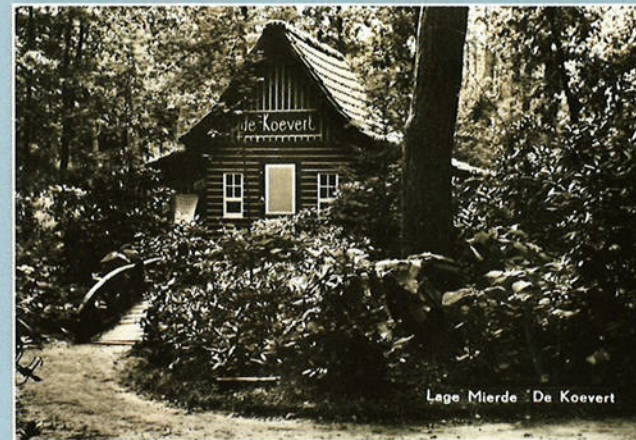
Lage Mierde 'De Koevert'

Van boven naar beneden: het vieren van een gouden bruiloft op landgoed Nieuwkerk onder Goirle. Vooral de 'Kettingbrug' was populair, ±1925. Het idyllische cafeetje De Koevert aan de Reusel op landgoed De Utrecht werd helaas afgebroken in de jaren '60. Rond datzelfde landgoed lagen toen al campings, met wervende teksten.