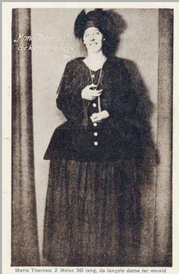
Maria Theresia 2 Meter 30 lang, de langste dame ter wereld

Robot Volta: machine-mens of pop, 1910. (Prentbriefkaart.)