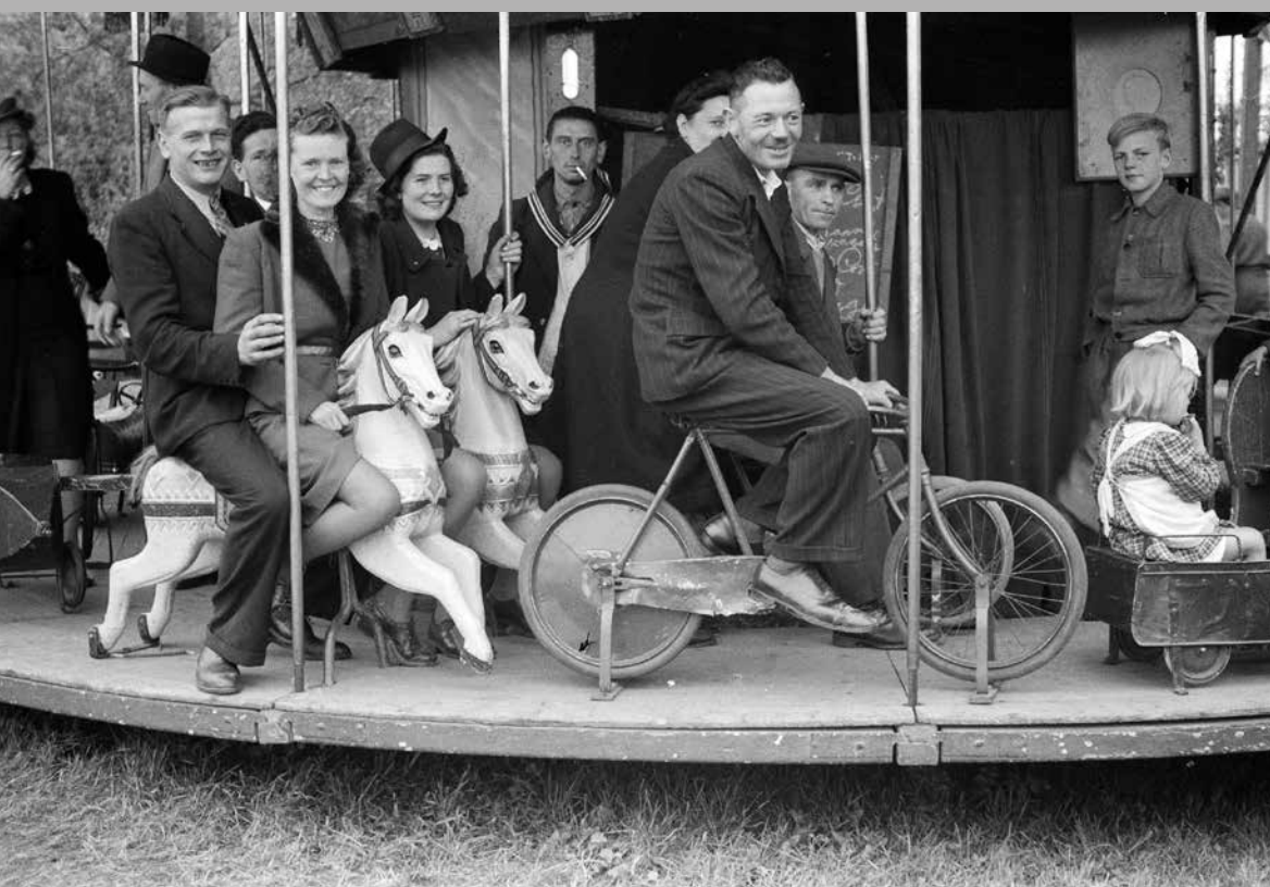
Plezier voor jong en oud op de draaimolen, tijdens de kermis in een van de Maasdorpen in de regio Oss, jaren '50.