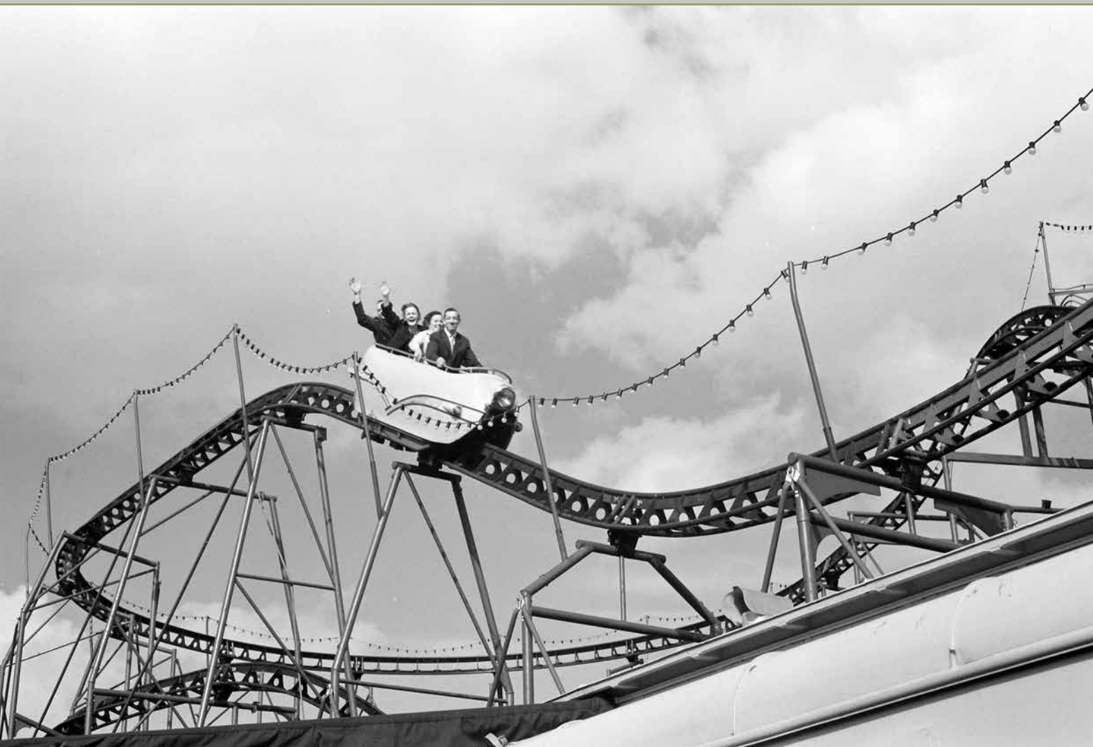
Met volle vaart in de achtbaan, Oss, jaren '50.