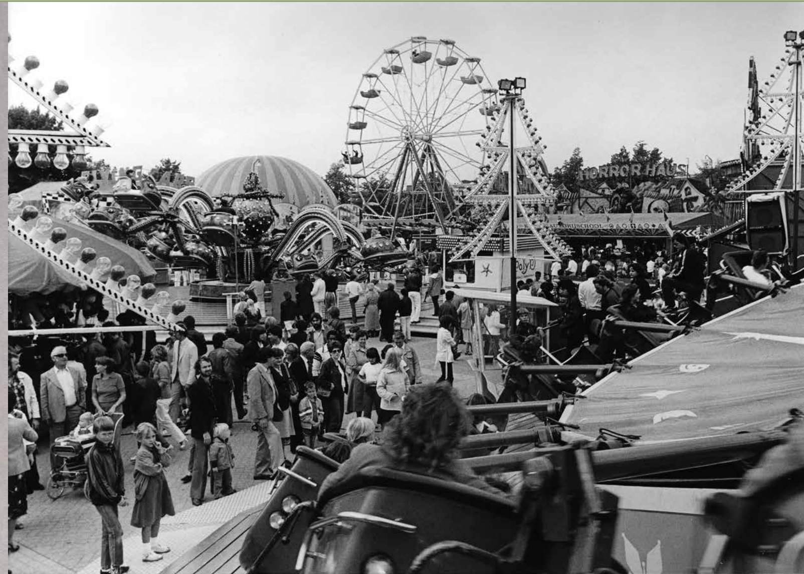
Druk te op de Osse kermis in 1980.