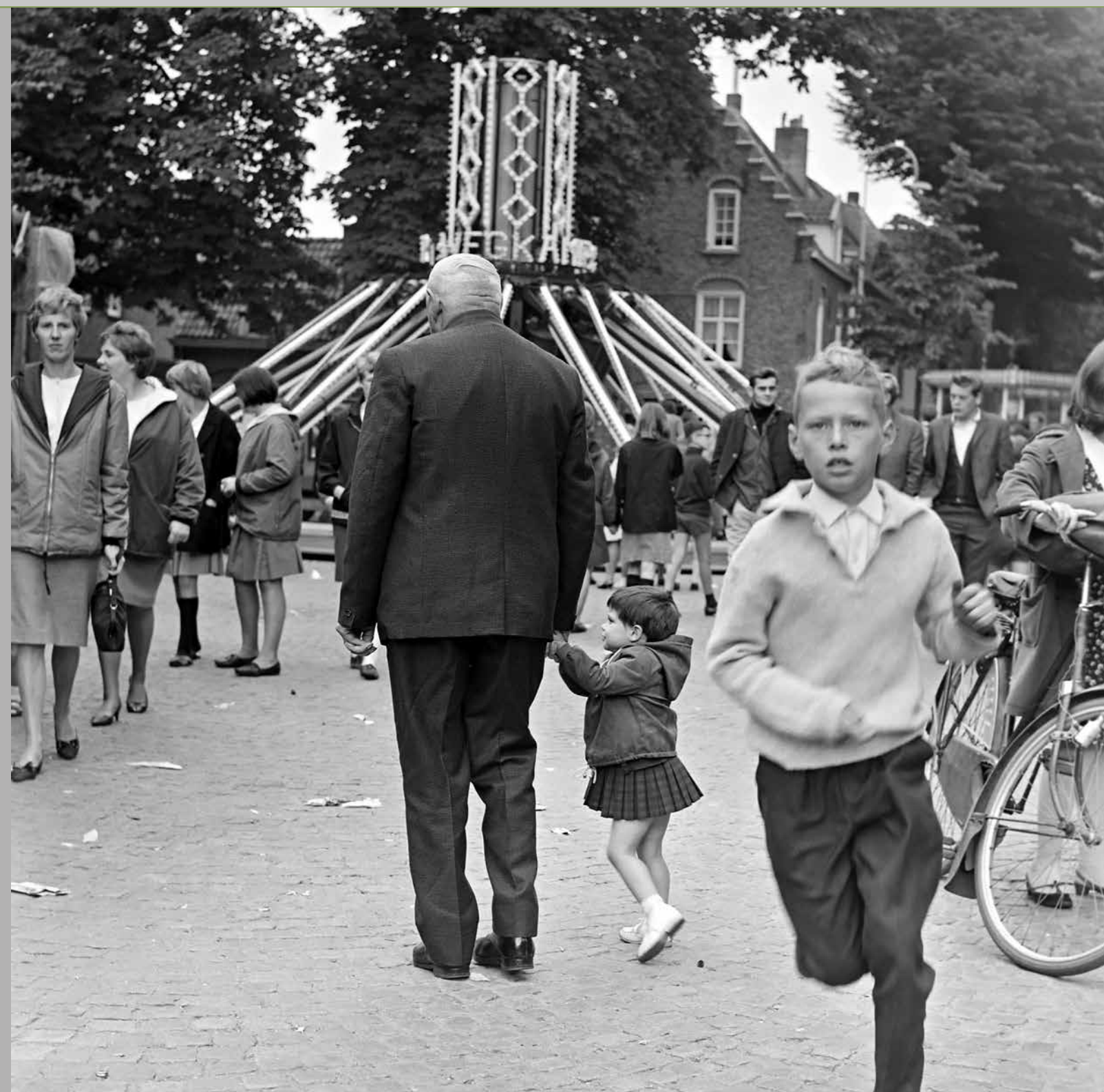
Kermis op de Besterd, Tilburg, 1966.