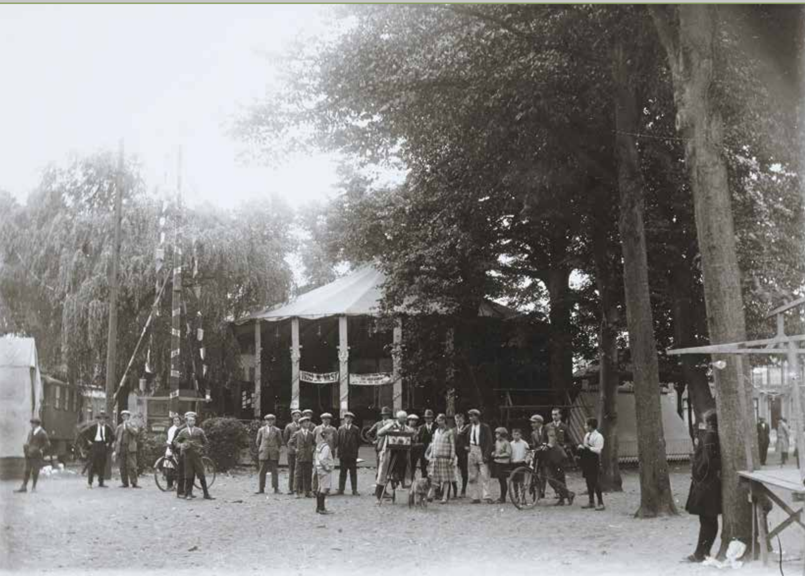
De rups en de rarekiek op de kermis, Waalre, circa 1907.