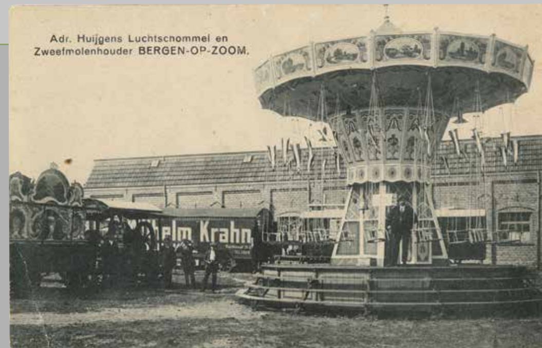
Zweefmolen van Adr. Huijgens, Bergen op Zoom, 1930. (Prentbriefkaart. Collectie: West-Brabants Archief)