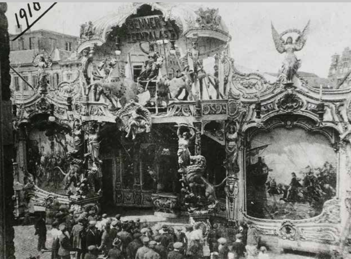
Benner's Feenpalast, 's-Hertogenbosch, 1918.