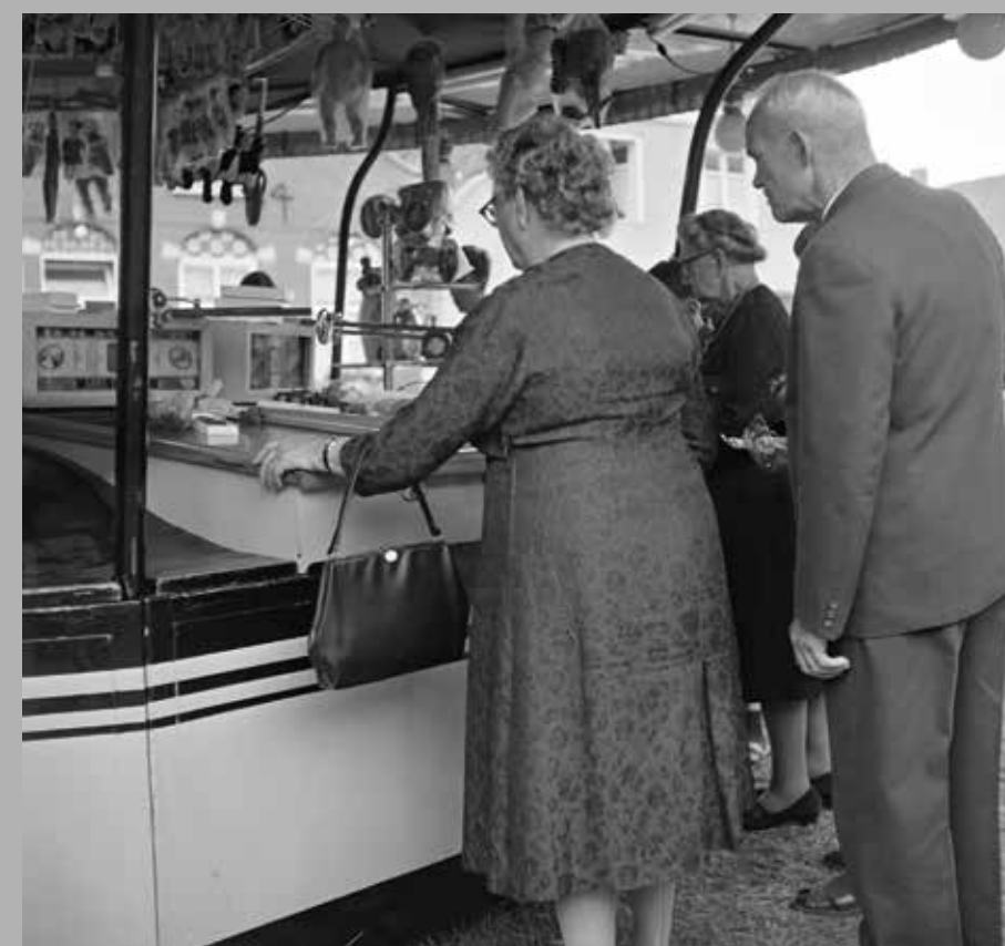
Bij de gokkraam, Tilburg, 1964.