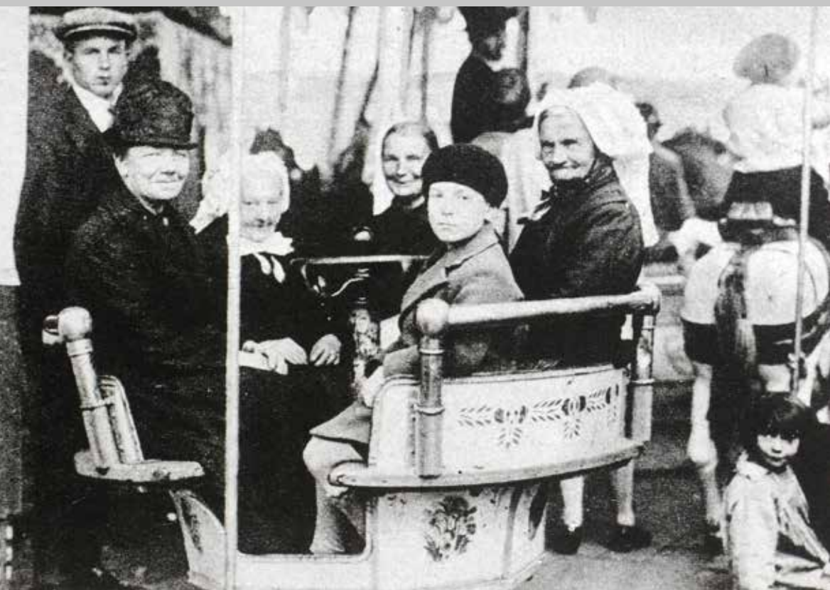
Opoes in de mallenmolen tijdens de kermis, 's-Hertogenbosch, september 1930.