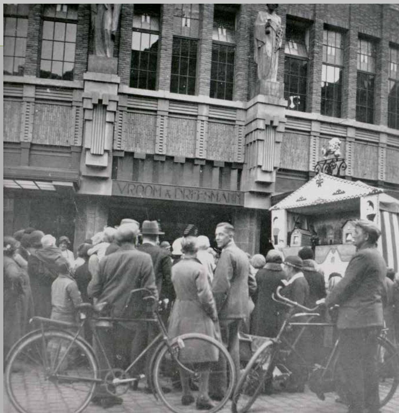
Poppenkast op de kermis voor het warenhuis van Vroom & Dreesmann, 's-Hertogenbosch, circa 1935.