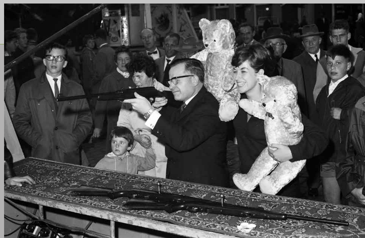
De schietent, Oss, circa 1960.