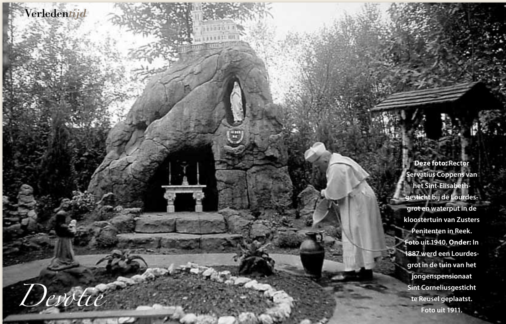
Deze foto: Rector Servatius Coppens van het Sint-Elisabethgesticht bij de Lourdesgrot en waterput in de kloostertuin van Zusters Penitenten in Reek. Foto uit 1940. Onder: In 1887 werd een Lourdesgrot in de tuin van het jongenspensionaat Sint-Corneliusgesticht te Reusel geplaatst. Foto uit 1911.