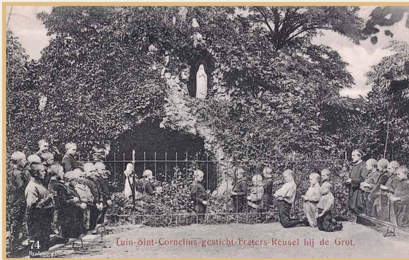
Tuin-Sint-Cornelius-gesticht-Fraters-Reusel bij de Grot.